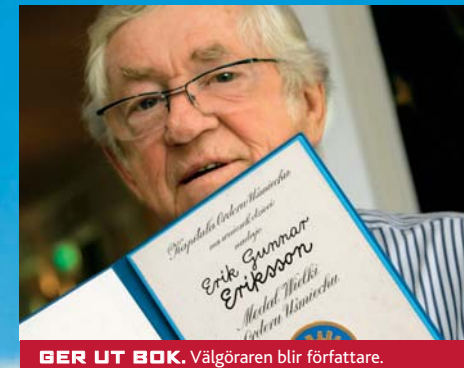
GER UT BOK. Välgöraren blir författare.

– Många gånger fick jag höra att ”du kan inte lova om du inte har några pengar”, men det blev min drivkraft. Man kommer hem och så har man kanske lovat bygga ett